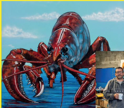
Expo du 14/01 au 31/01

Impactk est graffeur depuis 1996, il mêle bombe, acrylique et couteau. Le tout entre 3D et fresques monumentales.